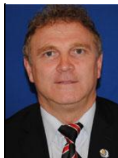
NEGRUȚ Clement Deputat PD-L