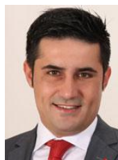
MANDA Iulian Claudiu Deputat PSD