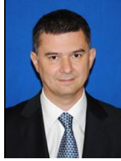
STERIU Valeriu-Andrei Deputat PSD