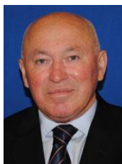
MOCANU Vasile Deputat PSD