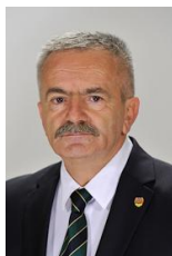
VALECA Șerban-Constantin Senator PSD