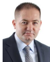
COMȘA Cornel-George Deputat PP-DD