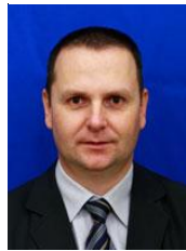
DONȚU Mihai-Aurel Deputat PNL