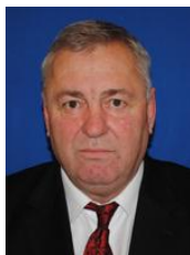
STAN Ioan Deputat PSD