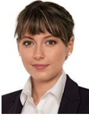
ȘTEFĂNESCU Elena Cătălina Deputat PSD