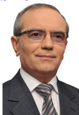
OPREA Dumitru Senator PDL