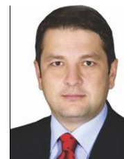
CIUCĂ Liviu-Bogdan Deputat PC