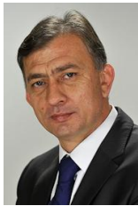
POPESCU Dumitru-Dian Senator PNL